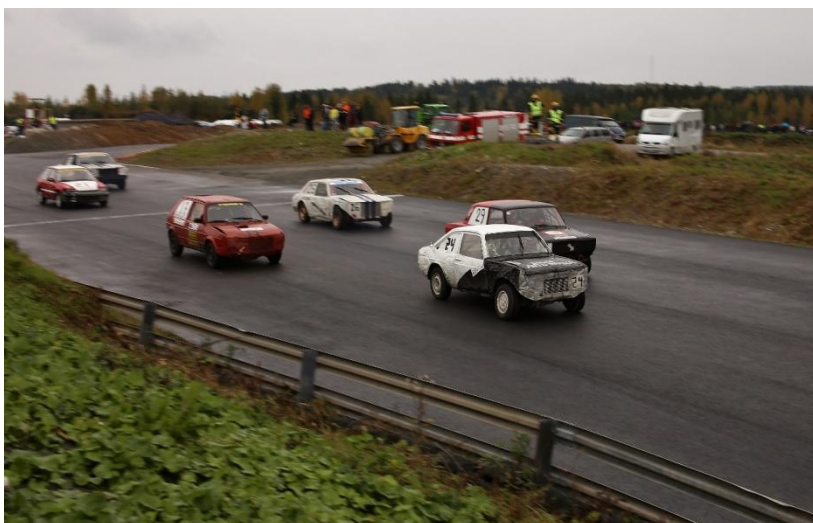
Arctic Machine JM 2013